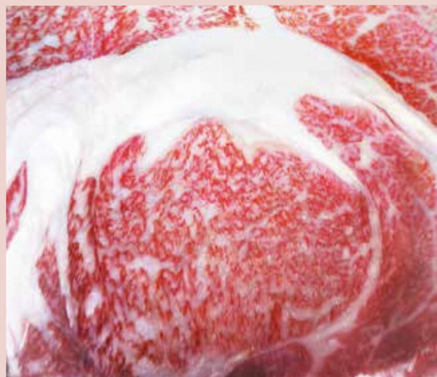
性別：去勢 血統：多久実×平忠勝×福栄 BMS No.12 枝肉重量 490kg ロース芯面積 74cm 2 (福島・郡山 R4.11.28)