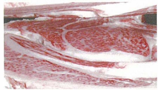
血統 喜多平茂-安福久-平茂勝(去勢) BMS.No.11 枝肉重量585kg