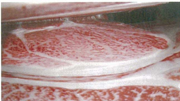
検定牛1 高百合-平茂勝-東平茂 BMS.No.11 ロース芯面積86cm 2 枝肉重量585kg