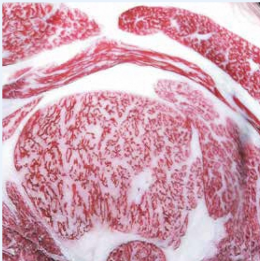
性別：雌 血統：福平晴×茂勝×北国7の8 BMS No.11 枝肉重量 461.5kg ロース芯面積 75cm 2 (福島・郡山 R4.5.16)