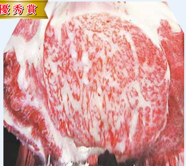
性別：雌 血統：福平晴×義平福×勝忠平 BMS No.12 枝肉重量 473kg ロース芯面積 76cm 2 (東京・品川 R2.12.3)