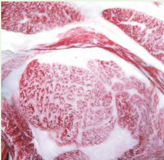
性別：雌 血統：勝忠安福×福増×高百合 BMS No.12 枝肉重量 452.5kg ロース芯面積 62cm 2 (福島・郡山 R4.5.16)